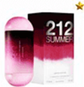
عطر زنانه کارولینا هرا 212 سامر Carolina Herrera 212 Summer for women