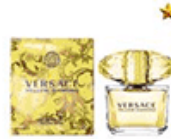
عطر زنانه ورساچه یلو دایموند Versace Yellow Diamond for women