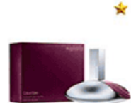
عطر زنانه ایفوریا کلونین کلین Calvin Klein Euphoria