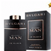
ادکلن مردانه بولگاری من این بلک Bvlgari Man In Black Bvlgari For Men