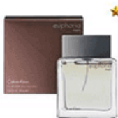
ادکلن مردانه ایفوریا اینتنس کلونین کلین Euphoria Intense Calvin Klein for men