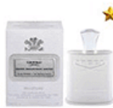
ادکلن مردانه کرید سیلور مانتین واتر Creed Silver Mountain Water for men