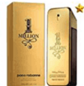
ادکلن پاکو رایان وان میلیون اینتنس مردانه Paco Rabanne One Million Intense