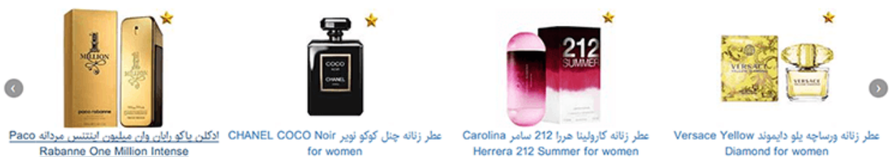
ادکلن پاکو رابان وان میلیون اینتنس مردانه Paco Rabanne One Million Intense